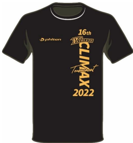
ブラック/ゴールド ¥2,500