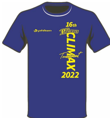
ロイヤルブルー/イエロー ¥2,500