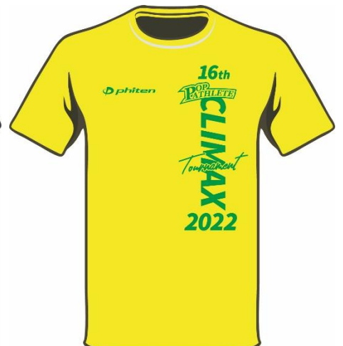
フラッシュイエロー/グリーン ¥2,500

※本 T シャツにはファイテン独自のナノテクノロジー技術「アクアチタン」が含まれています。リラックスをサポートする T シャツ素材です。